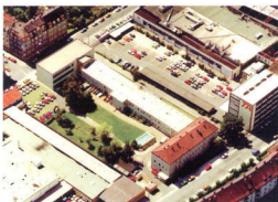
诺力士纽伦堡总部

■德国诺力士集团于1925年成立于德国纽伦堡。创建初期主要从事机械电子测量仪的研制。1960年，开发出第一代船用自动化系统，并于1966年成功应用于德国